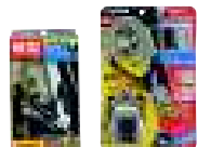
クリアケース ブリスター