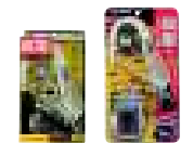
クリアケース ブリスター