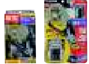
クリアケース ブリスター