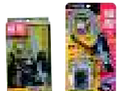
クリアケース ブリスター