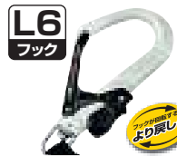
ALMAX 鍛造アルミフック