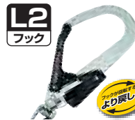
硬質焼入ゲート スチールフック