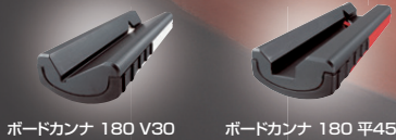
ボードカンナ 180 V30 ボードカンナ 180 平45

台(ベース)には、変形せず磨耗しにくいアルミダイカストを採用、適度な重量が面取り作業を安定させます。