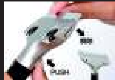
セーフティパネ内蔵 交換時もブレードが落ちにくい