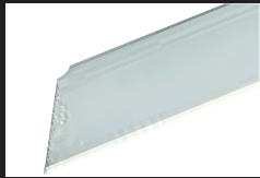
折れ線無し刃採用 耐久性に優れた専用ブレード