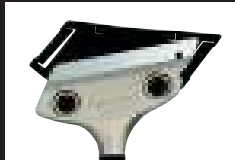
刃先カバー付 ブレードカバーで危険防止