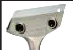
ダブルネジ採用 耐久性と保持力をアップ