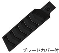
ブレードカバー付