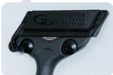
カバー装着時 ブレードカバーで替刃の刃先を保護します。