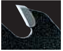
超微粒 タングステン カーバイドチップ