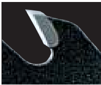
超微粒 タングステン カーバイドチップ