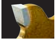
鋭角薄刃+軽量台金