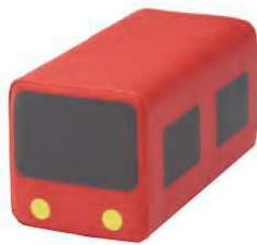
トレインクッション レッド 品番 / KS-TC-R (旧品番 / AO-100R)