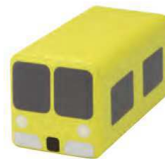
トレインクッション イエロー 品番 / KS-TC-Y (旧品番 / AO-100Y)