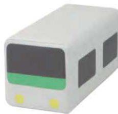
トレインクッション グレー 品番 / KS-TC-GY (旧品番 / AO-100GY)