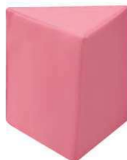
ソフトクッション 三角 品番 / KS-SC-T (旧品番 / AO-01)