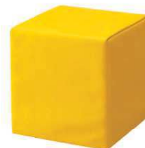
ソフトクッション 四角 品番 / KS-SC-S (旧品番 / AO-03)