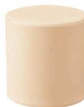
ソフトクッション 丸 品番 / KS-SC-R (旧品番 / AO-02)