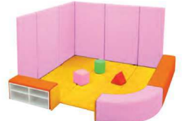
設置プラン1 ※くわしくはP34をご参照ください。