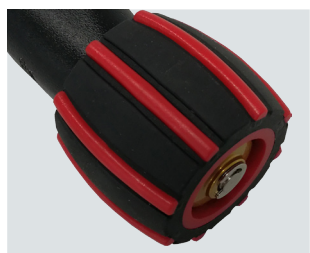
しっかりホールドできるグリップエンド