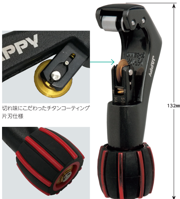
切れ味にこだわったチタンコーティング 片刃仕様