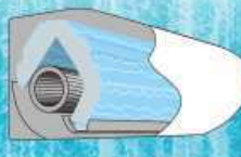
一気に溶かして汚れを洗い流す