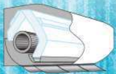
急速冷却で熱交換器に大量の霜をつける

熱交換器を凍らせて霜をつけ、たくわえた霜を一気に溶かして汚れを洗い流す新方式の熱交換器自動お掃除[凍結洗浄]を採用しました。