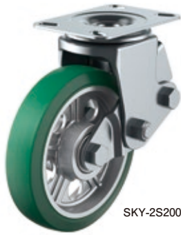
SKY-2S200AW (AR) Gr