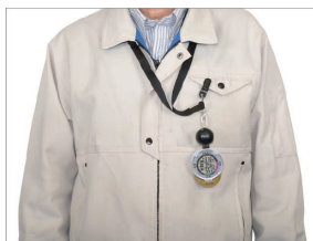
作業服の胸ポケット