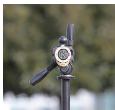
三脚に取り付けて