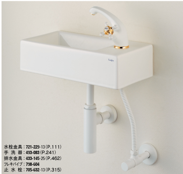
水栓金具：721-229-13 (P.111) 手洗器：493-083 (P.241) 排水金具：433-145-25 (P.462) フレキパイプ：798-604 止水栓：705-632-13 (P.315)