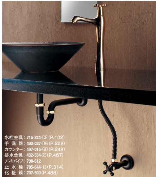
水栓金具：716-824-CG (P.102) 手洗器：493-037-DG (P.228) カウンター：497-015-GD (P.249) 排水金具：432-534-25 (P.467) フレキパイプ：798-612 止水栓：705-644-13 (P.314) 化粧鏡：207-500 (P.488)