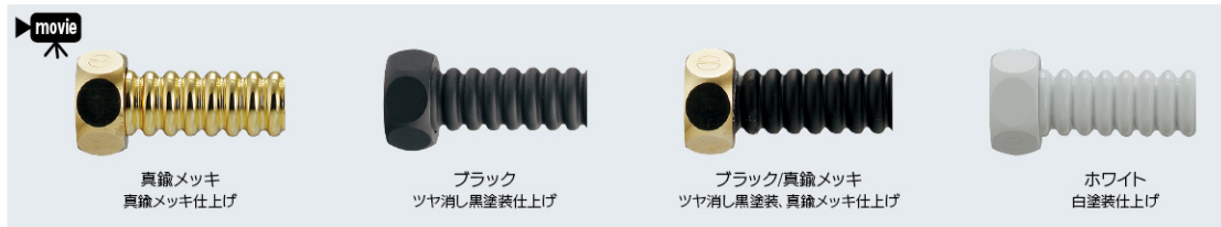
真鍮メッキ 真鍮メッキ仕上げ