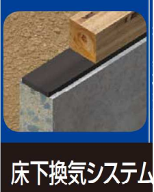
床下換気システム