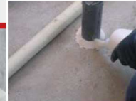
●アリダンコーキング