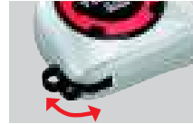
安全ロープ取付環 (本体収納型)