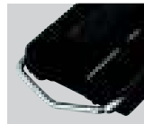
安全ロープ取付環 (ベルトホルダー)