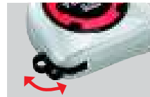
安全ロープ取付環 (本体収納型)