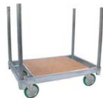
支柱(単管パイプ)付 (オプション)