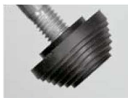
ゴムカバー付石突き フローリング・床を傷つけない ゴム足カバー