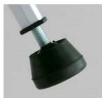
ゴムカバー付石突き フローリング・床を傷つけない ゴム足カバー