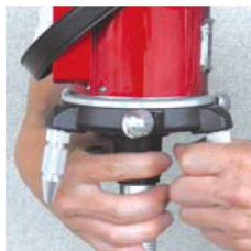
レーザー本体を回転 させずに取付できる 回転グリップ付