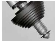
地面などもしっかり止まる石突き