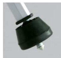
地面などもしっかり止まる石突き